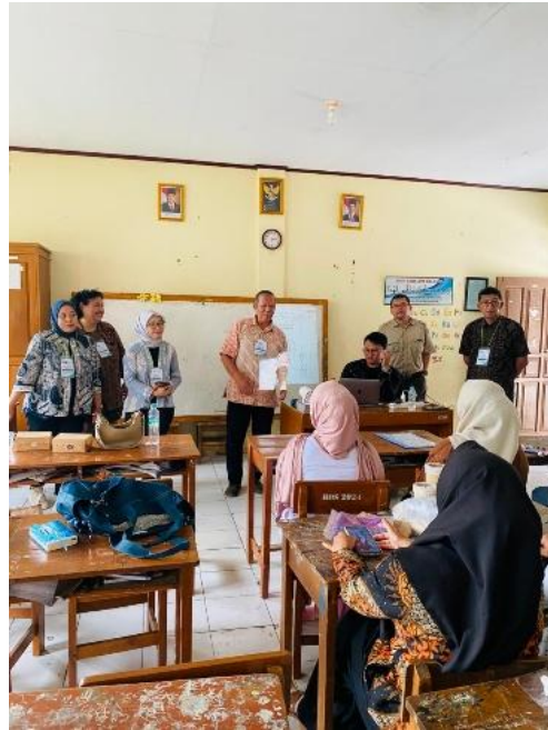
Gambar 1 Pemberian Penyuluhan sosial kepada pengelola homestay