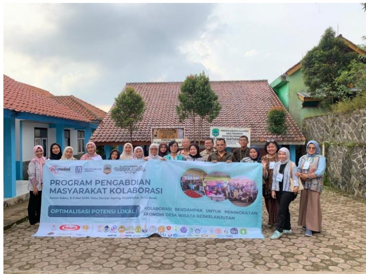
Gambar 4 Melakukan survey langsung dan evaluasi di homestay Masyarakat

Tim PKM melakukan pendampingan kepada warga dalam menerapkan hasil pelatihan pada rumah masing-masing. Pendampingan dilakukan untuk membantu peserta menyesuaikan kondisi rumah dengan standar homestay wisata yang sederhana namun layak dan nyaman bagi wisatawan.