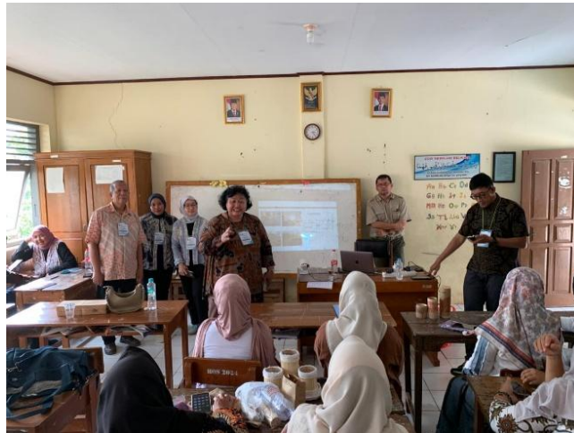
Gambar 3 Pelatihan mengenai pengelolaan homestay