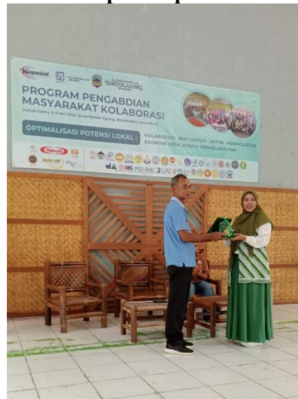
Gambar 2 Penyerahan Plakat Kepada Kepala Desa Bantaragung, Majalengka

Pada tahap ini Tim pelaksana melakukan koordinasi dengan pemerintah desa/kelurahan, pengurus PKK, tokoh masyarakat, serta pihak terkait lainnya untuk memperoleh dukungan dan kesepakatan mengenai pelaksanaan program. Pada tahap ini dilakukan pembahasan mengenai waktu pelaksanaan, jumlah peserta, lokasi kegiatan, serta bentuk dukungan yang dapat diberikan oleh mitra. Koordinasi ini bertujuan untuk membangun kerja sama yang baik antara tim pelaksana dan masyarakat sehingga program yang dilaksanakan sesuai dengan kondisi dan kebutuhan peserta.