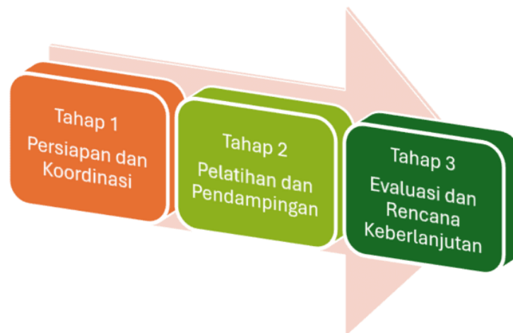
Gambar 1 Tahapan Pengabdian Kepada Masyarakat di Desa Bantaragung

Secara garis besar, metode pelaksanaan kegiatan ini dibagi menjadi empat tahapan utama yang sistematis, sebagai berikut: