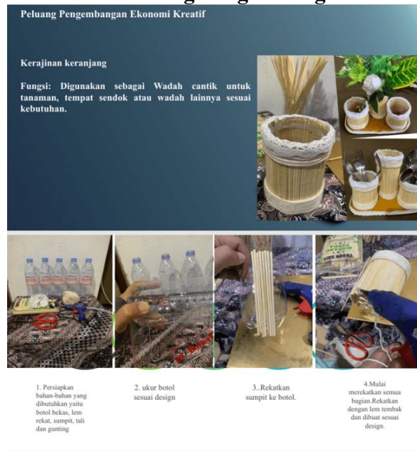
Gambar 4 Wawasan Peluang Pengembangan Ekonomi Kreatif