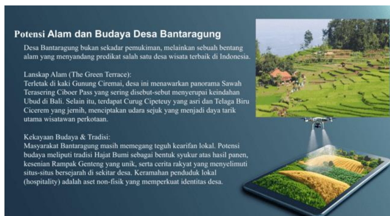
Gambar 2 Potensi Alam Desa Bantaragung