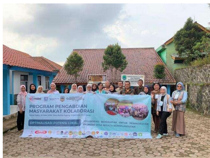
Gambar 6 Foto Bersama setelah Evaluasi Bersama Ibu-ibu PKK